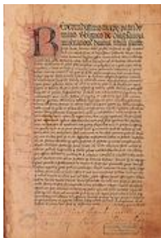
Długosz Jan, Kroniki , 1480 - Biblioteka Czartoryskich, Kraków