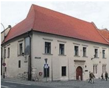
Kraków, Dom Długosza, fot. S. Stachowski/Archiwum Ilustracji WN PWN SA © Wydawnictwo Naukowe PWN

Źródło: http://encyklopedia.pwn.pl/haslo/Dlugosz-Jan;3893085.html